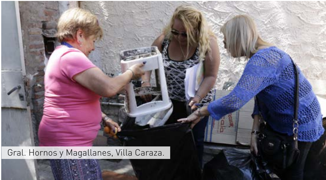
Gral. Hornos y Magallanes, Villa Caraza.