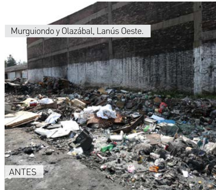
Murguiondo y Olazábal, Lanús Oeste.