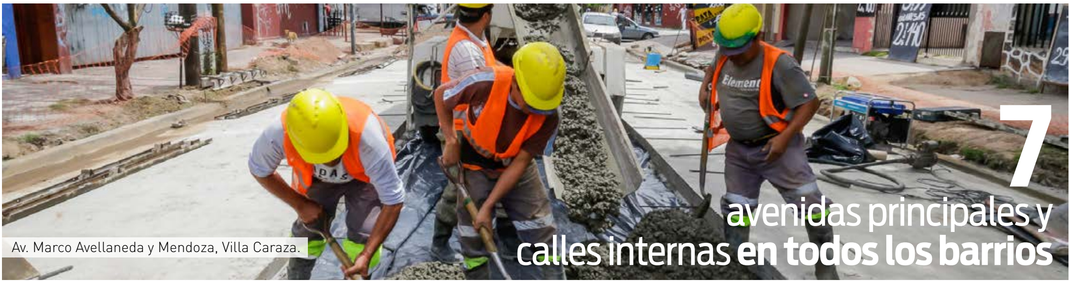
Av. Marco Avellaneda y Mendoza, Villa Caraza.

7 avenidas principales y calles internas en todos los barrios