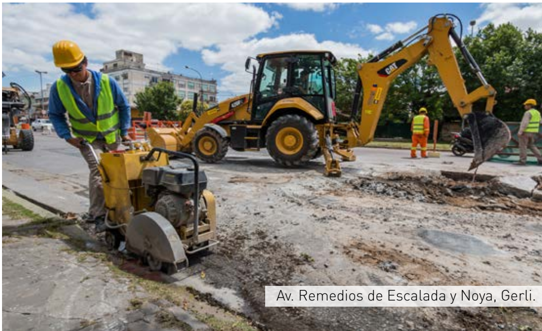
Av. Remedios de Escalada y Noya, Gerli.

7 avenidas principales y calles internas en todos los barrios