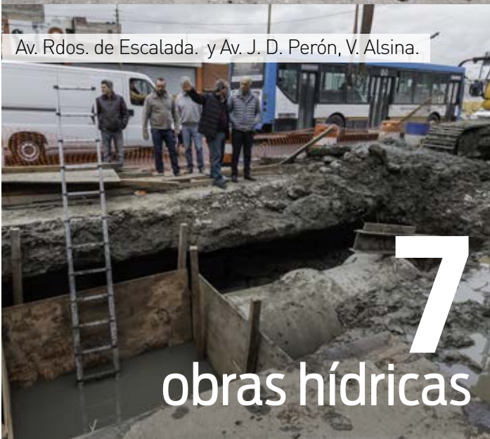
Av. Rdos. de Escalada. y Av. J. D. Perón, V. Alsina.