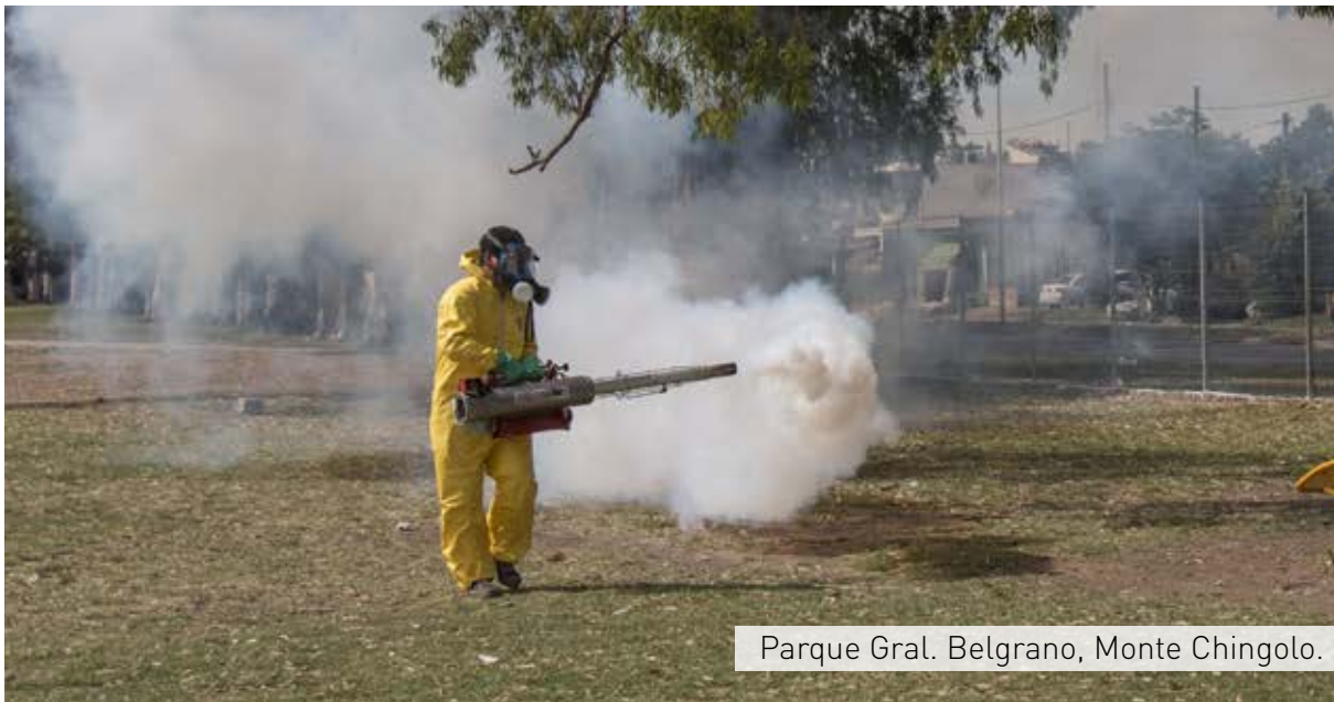
Parque Gral. Belgrano, Monte Chingolo.