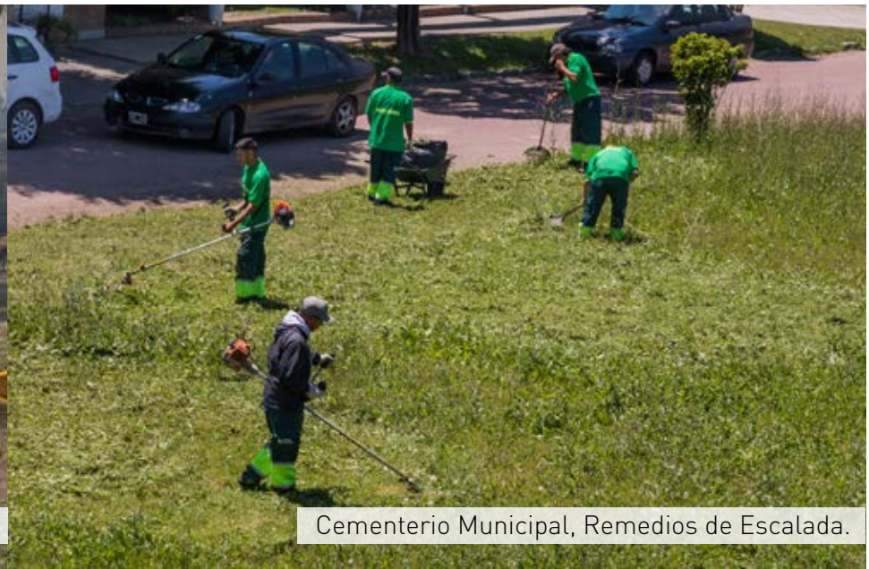
Cementerio Municipal, Remedios de Escalada.