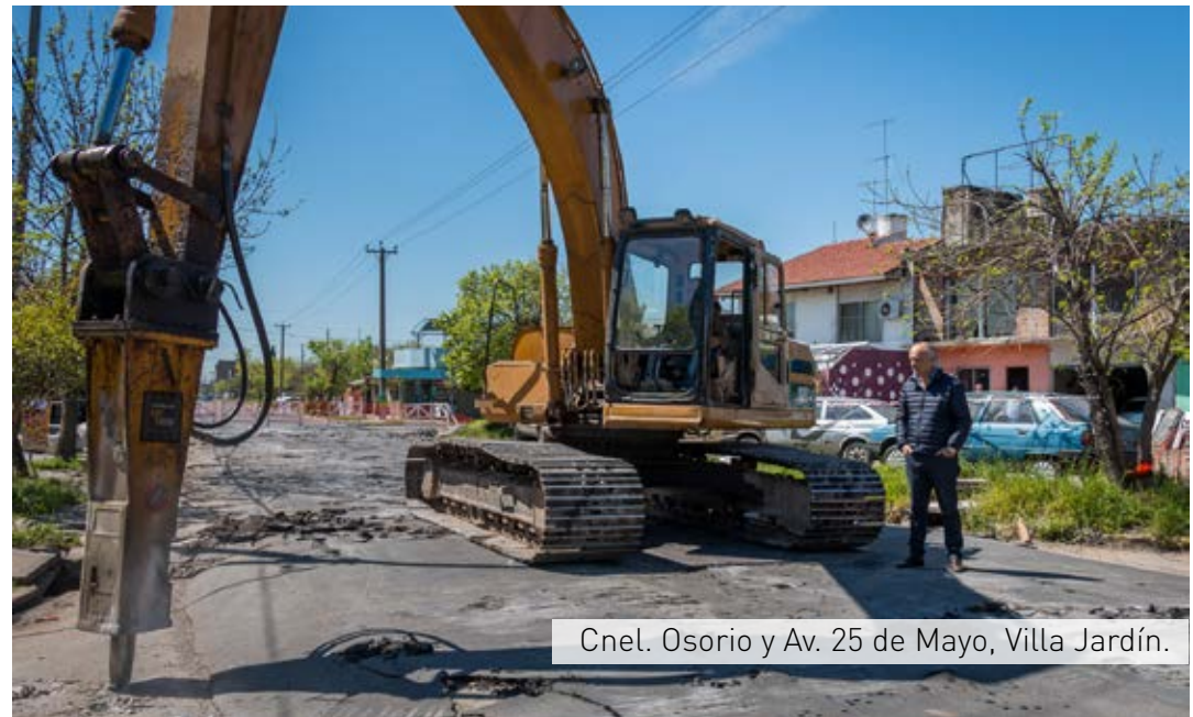
Cnel. Osorio y Av. 25 de Mayo, Villa Jardín.