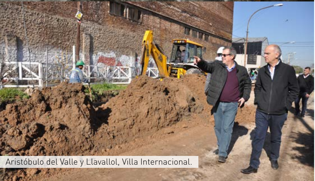
Aristóbulo del Valle y Llavallol, Villa Internacional.