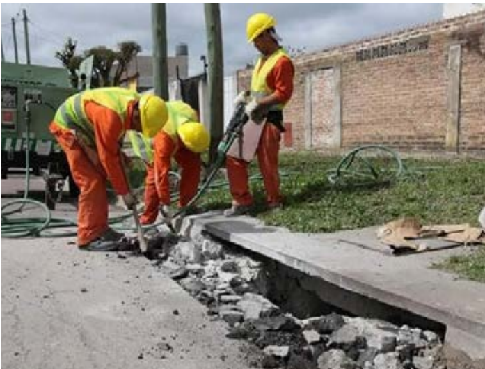
Alvear y Pedernera, Lanús Este.